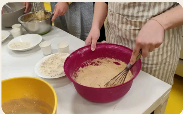
Igiene alimentare e sicurezza (HACCP)