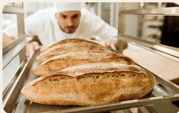
Ingredienti, impasti e processi di lievitazione