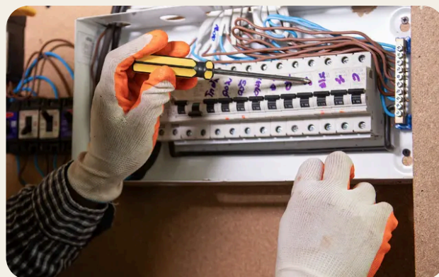
Rischio elettrico e misure di prevenzione