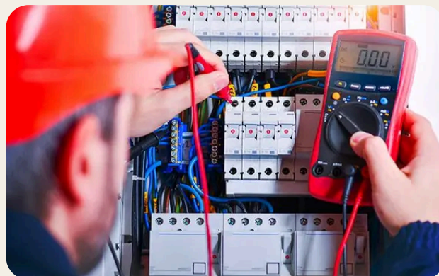
Addestramento pratico e simulazioni operative