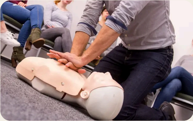
Aggiornamento normativo e organizzazione del primo soccorso