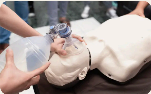
Gestione di traumi e malori