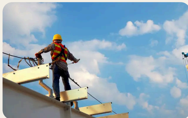
Organizzazione della sicurezza aziendale