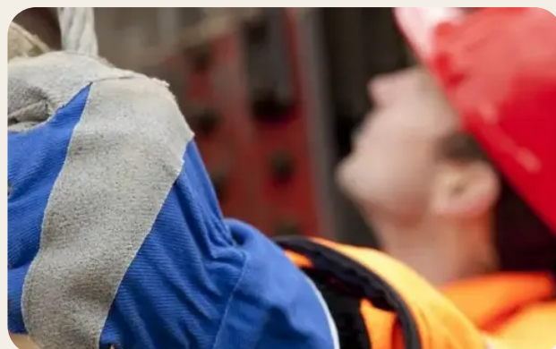
Procedure di prevenzione e protezione