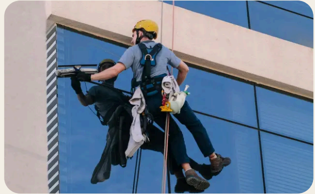
Rischio di caduta dall'alto e sistemi di protezione