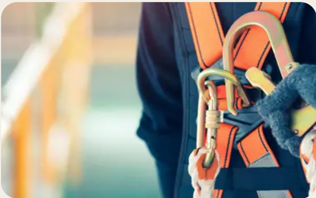
DPI di III categoria anticaduta