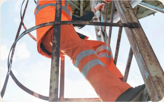
Normativa e responsabilità nei lavori in quota