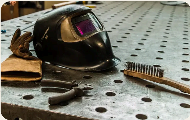
Individuazione dei rischi e misure di prevenzione