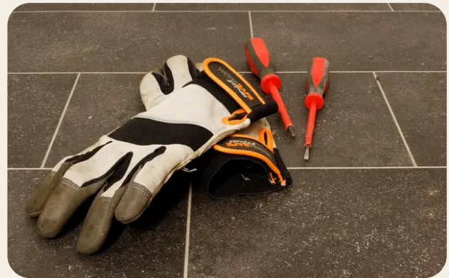
Diritti, doveri e strumenti operativi dell'RLS