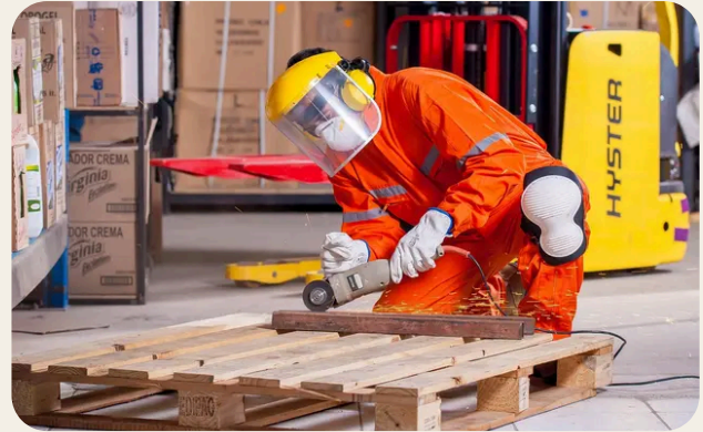
Sistema di prevenzione aziendale e valutazione dei rischi