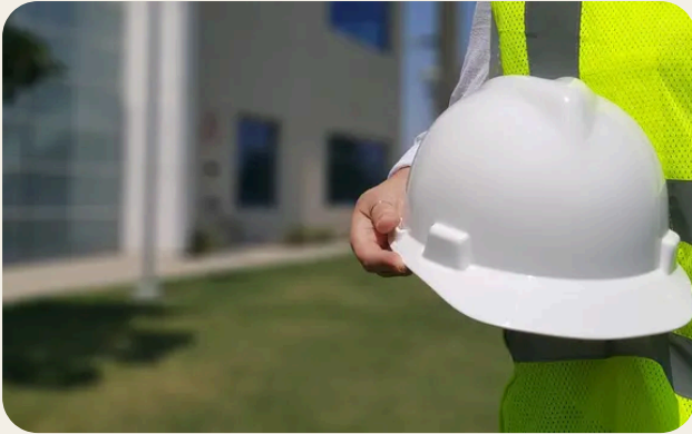
Normativa di riferimento e ruolo dell'RLS