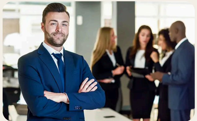
Leadership, comunicazione e cultura della prevenzione