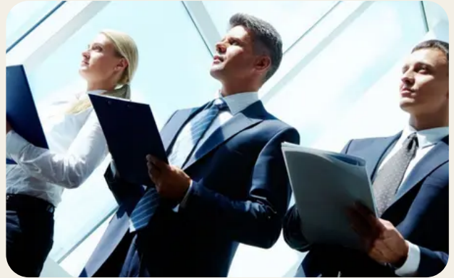
Organizzazione della sicurezza e gestione dei rischi