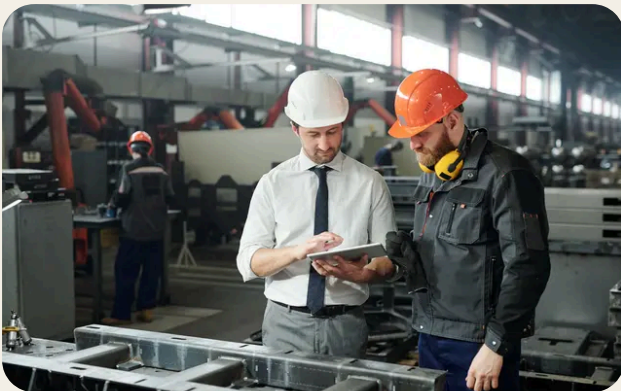
Leadership, comunicazione e cultura della prevenzione