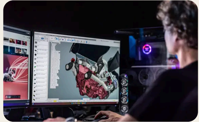
Disegno tecnico e modellazione 2D/3D