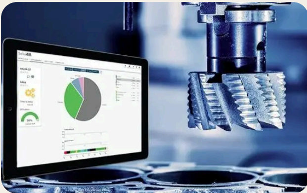
Principi di programmazione CAM