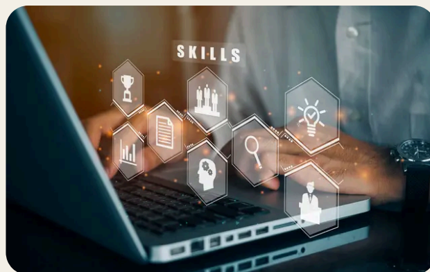
Gestione dei principali social network