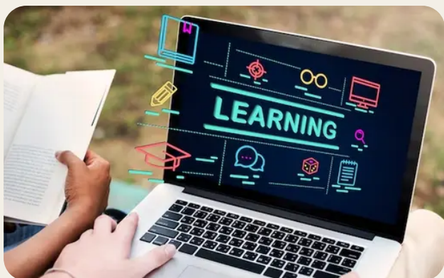
Strategie e basi del social media marketing