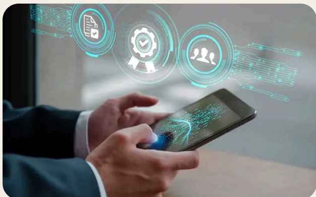
Creazione contenuti e piano editoriale